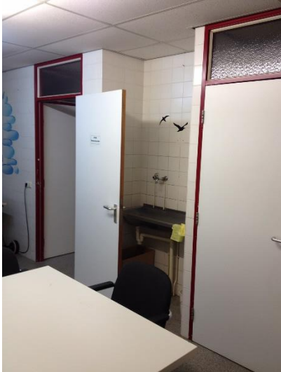
Zo was het